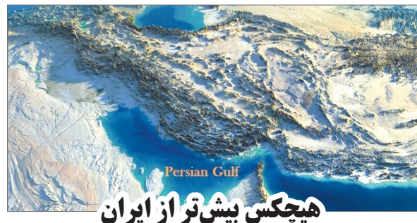
هیچکس بیش تر از ایران از صلح در منطقه سود نمی برد