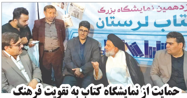
حمایت از نمایشگاه کتاب به تقویت فرهنگ جامعه کمک می کند