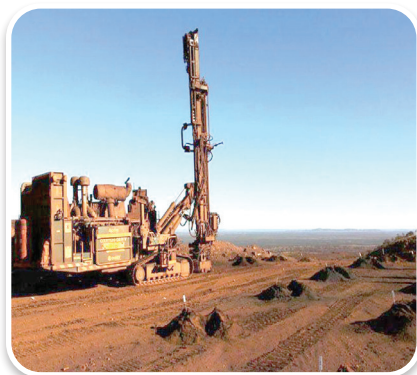
شود، روسها هم مانند شرکت های دیگر فقط تولید اطلاعات پایه را در مرحله شناسایی و پی جویی انجام می دهند و هیچ کار دیگری جزء این انجام نمی دهند.