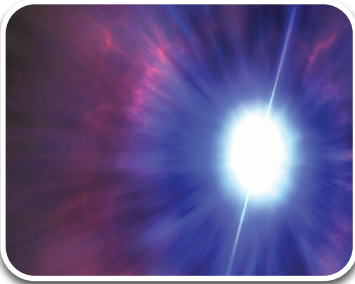
که به عنوان یکی از قوی ترین و درخشان ترین انفجارهای جهان شناخته می شود.

نوع رویداد یک انفجار پرتو گاما (GRB) ۲۲۱۰۰۹