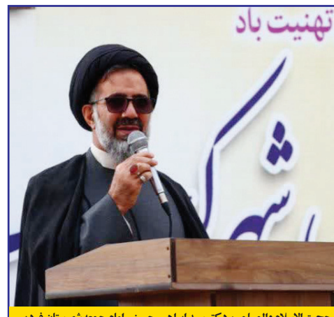
حجت الاسلام والمسلمین دکتر سید ابراهیم حسینی امام جمعه شهرستان فردیس