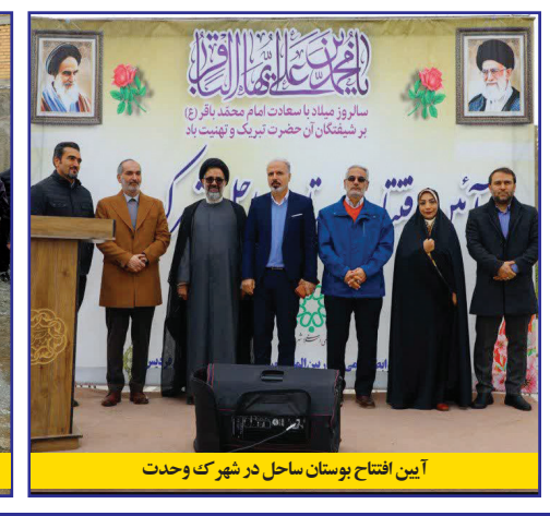
آیین افتتاح بوستان ساحل در شهرک وحدت