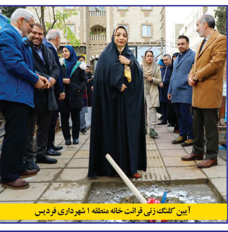
آیین کلنگ زنی فرات خانه منطقه ۱ شهرداری فردیس

وی یادآور شد: برای ۵۰۰ نفر جمعیت یک متر فضای سبز در نظر گرفته می شود و با توجه به تراکم جمعیت در فردیس، برای ۵۰۰ هزار نفر جمعیت ۵۰ هکتار فضای سبز نیاز است. احمدی نژاد همچنین گفت: علاوه بر احداث پارک های فوق در فردیس، توسعه فضای سبز شهری از طریق درختکاری حاشیه های در سطح شهر و جنگل کاری در پهنه های باز در دستور کار قرار دارد. وی اضافه کرد: در حال حاضر بازسازی دو پارک در سطح شهر در حال انجام است؛ پارک اتحاد در رزکان و پارک اهلی در منطقه