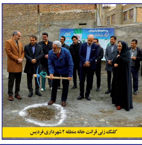
کلنگ زنی فرات خانه منطقه ۲ شهرداری فردیس

امام جمعه شهرستان فردیس: پیشرفت شهر فردیس در گرو تعامل در مدیریت شهری است امام جمعه فردیس گفت: عملکرد مثبت مسئولان به ویژه مدیران شهری در توسعه امکانات و افزایش خدمات شهری موجب امید آفرینی در جامعه و همراهی بیشتر شهروندان در انجام امور شهر است. حجت الاسلام سید ابراهیم حسینی امام جمعه فردیس، در مراسم افتتاح بوستان ساحل شهرک وحدت فردیس برگزار شد، اقدامات عمرانی و توسعه سرانه های شهر را موجب امید آفرینی در جامعه دانست و اظهار کرد: نهضت خدمت را مردم باید در عمل ببینند. توسعه سرانه ها و اقدامات عمرانی از جمله مواردی است که موجب شادی دل مردم و امید آفرینی در جامعه می شود.